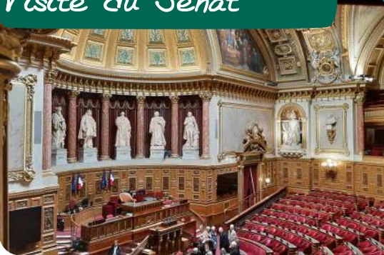
Visite du Sénat