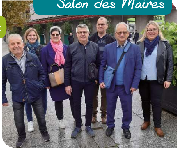
Salon des Maires