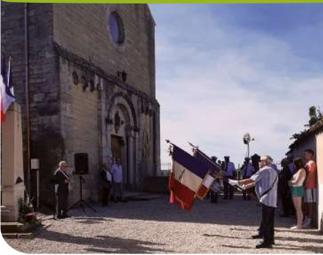
Cérémonie du 14 Juillet